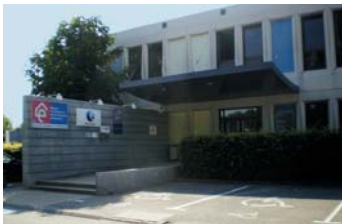
Maison de l'Emploi et de la Formation de Saverne

Au total, ce sont 300 personnes qui ont pu bénéficier d'un accompagnement en 2010. Sur le plan de la formation, le SIMOT, avec le soutien de la Région Alsace et de l'Agefiph, a pu construire et mettre en œuvre, avec des organismes techniques, des actions de préqualification et de qualification spécifiques. Elles ont permis de contribuer à la formation de 32 personnes.